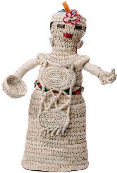
FIGURA MAPUCHE DE ÑOCHA